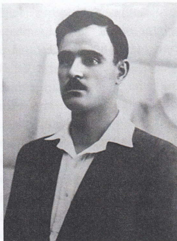
Gheorghe Gheorghiu-Dej, 1932.

locali. Drept urmare, la 19 decembrie 1931 a fost numit verificator al balanței financiare și apoi „prim bărbat de încredere” al sindicatului 16 . La întrunirile sindicaliştilor era de departe cel mai activ, criticând continuu conducerea sindicatului pentru reacția mult prea „moale” față de deteriorarea situației ceferiştilor („nu-și dau tovarășii nici un interes, ca și când ar fi foarte mulțămiiți cu soarta din prezent”; „mai mult lucră contra tovarășilor decât în favoarea lor”) 17 .