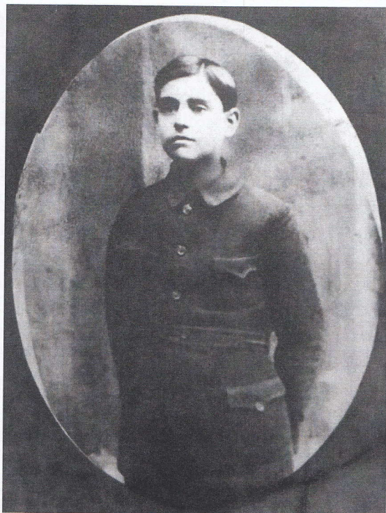
Portret. Gheorghe Gheorghiu-Dej la 15 ani.

angajat imediat ca muncitor la o fabrică de cherestea. Vârsta și lipsa unei calificări l-au obligat să-și schimbe însă în mai multe rânduri locul de muncă: a muncit la o țesătorie, apoi la niște meșteri dogari din Piatra Neamț și Moinești 4 .