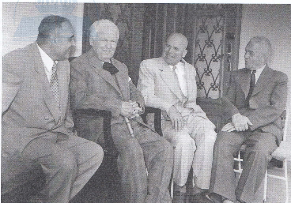
Gh. Gheorghiu-Dej în vizită la casa lui Mihail Sadoveanu de lângă Târgu-Neamț, iulie 1958.

Anul 1956, anul prezentării Raportului secret de către N.S. Hrușciov, a avut o importanță covârșitoare pentru evoluția fenomenului cultului personalității în blocul răsăritean. La fel de decisiv a fost acest an și pentru cariera lui Gheorghiu-Dej, care avea să contracareze acțiunile rivalilor săi și să-și păstreze puterea. Încercând să concluzionăm cele prezentate mai sus, referitor la imaginea lui Gheorghiu-Dej în presa anului 1956, remarcăm următoarele: