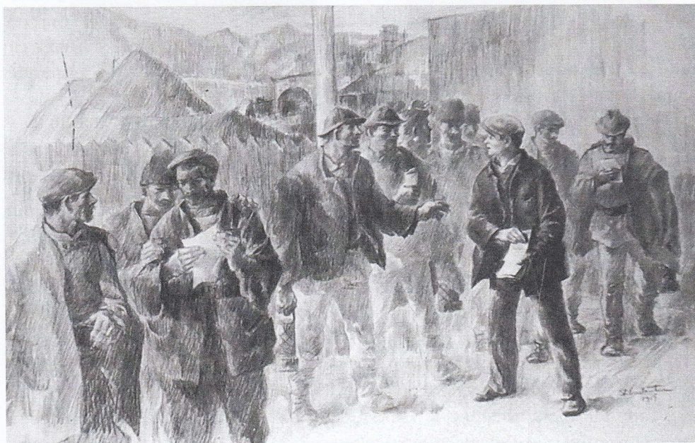
Foto-desen reprezentând pe tov. Gheorghe Gheorghiu-Dej răspândind manifeste printre muncitorii greviști din Valea Troțuşului (Băcau), 1919.

Prezența la greva din 1920 a constituit însă motivul concedierii lui Gheorghiu-Dej, care a fost nevoit să meargă și mai departe de casă, la Câmpina, unde a lucrat ca electrician la o rafinărie 7 . În 1921 a plecat la Galați, reușind să se angajeze la Societatea de Tramvaie. A efectuat serviciul militar cu contingentul 1923, la Regimentul 3 Pionieri din Focșani, având gradul de sergent. Revenit la locul de muncă, a fost concediat la scurt timp, întrucât, conform materialelor de propagandă postbelice, organizase mai multe proteste ale muncitorilor împotriva introducerii zilei de muncă de nouă ore, cerând totodată creșterea salariilor acestora 8 . Gheorghiu-Dej și-a găsit rapid un nou loc de muncă, angajându-se ca electrician la Atelierele C.F.R. Galați, unde, în 1929, s-a întâlnit pentru prima dată cu Gheorghe Apostol, care era pe atunci ucenic și elev la Școala profesională a atelierelor 9 . Putem aminti aici și demersul întreprins de Gheorghiu-Dej, în vara anului 1930, pentru obținerea postului de electrician montor-șef la Uzinele Comunale de Apă și Electricitate din Piatra-Neamț, însă – în pofida avizului favorabil al conducerii uzinelor, primit la 15 septembrie –, primăria nu avea să-și dea acordul 10 .